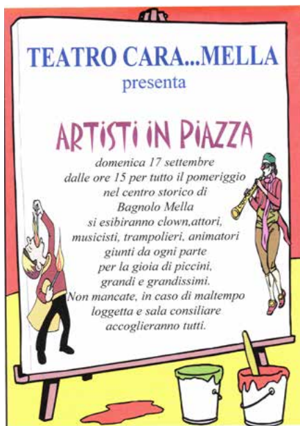
Locandina "Artisti in piazza"

Negli anni 1996/1999 il Teatro CaraMella ha partecipato all'organizzazione di Pressione Bassa , la stagione teatrale della Bassa Bresciana, curando in particolare le sedi di Bagnolo Mella e San Zeno Naviglio. Molti spettacoli sono stati presentati all'interno di questa rassegna, oltre a quelli prodotti da CaraMella stessa. Tra i partecipanti curati dalla nostra Associazione segnaliamo Cesar Brie, Anna Meacci, Giuseppe Cederna, Dario Vergassola, Gardi Hutter e molti altri. Tuttavia, al termine dell'edizione del 1999, vista l'impossibilità di poter partecipare in maniera attiva alle proposte artistiche, il Teatro CaraMella ha preferito abbandonare Pressione Bassa per dedicarsi a proposte teatrali autonome.