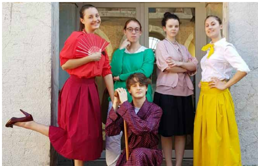
Saggio adolescenti "Il malato immaginario"