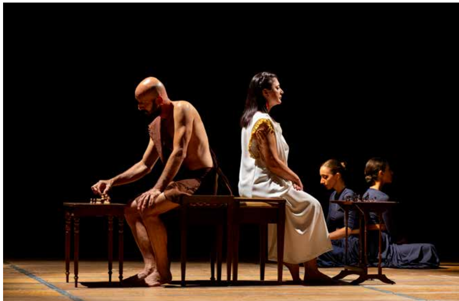
Spettacolo “L’eterno ritorno” all’interno di Call to Action

Dal 2005 in poi è strettissima la collaborazione con la Fondazione Dominato Leonense, con la produzione di spettacoli dedicati, laboratori per bambini e adulti, progetti comuni e naturalmente la prestigiosa sede di Villa Badia a Leno concessa dalla Fondazione all'Associazione CaraMella. Anche con la Fondazione Comunità Bresciana è attivo un rapporto che ha portato a realizzare due edizioni di una call to action : nel 2022/23 per Bergamo-Brescia capitale della cultura e nel 2025/26 con il progetto Carovana tuttora in corso.