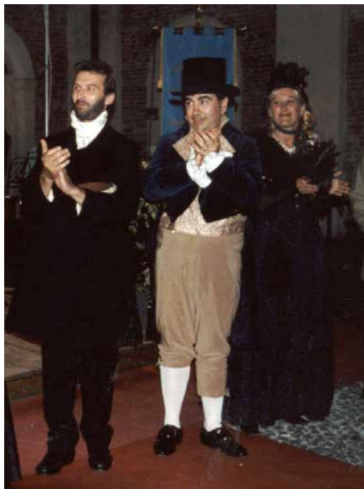
Verdi, uomo e il musicista

A partire dall'anno 2001 quindi il Teatro CaraMella inizia un percorso di produzioni dirette esclusivamente da membri dell'Associazione.