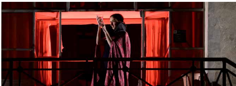
La passeggiata coi fantasmi

LA PASSEGGIATA COI FANTASMI: richiamandosi ad un genere teatrale molto diffuso nei paesi anglosassoni, il Teatro CaraMella nell'anno 2013 ha realizzato uno spettacolo itinerante basato sul sovrannaturale che, oltre a stimolare la paura come emozione fondamentale presente in ogni essere umano, presenta una successione di scene di grande caratura letteraria: Poe, Buzzati, Shakespeare, sono alcuni degli autori che accompagnano il cammino che si snoda in vari ambienti sì per suscitare paura, ma anche per far pensare e riflettere su noi stessi e sulle nostre angosce più segrete. Le storie si dipanano una dopo l'altra, inquietanti ma non disgustose: si è volutamente evitata qualsiasi scorciatoia splatter, per lavorare invece sulle emozioni sottili, che disturbano nel profondo perché permettono un'identificazione diretta.