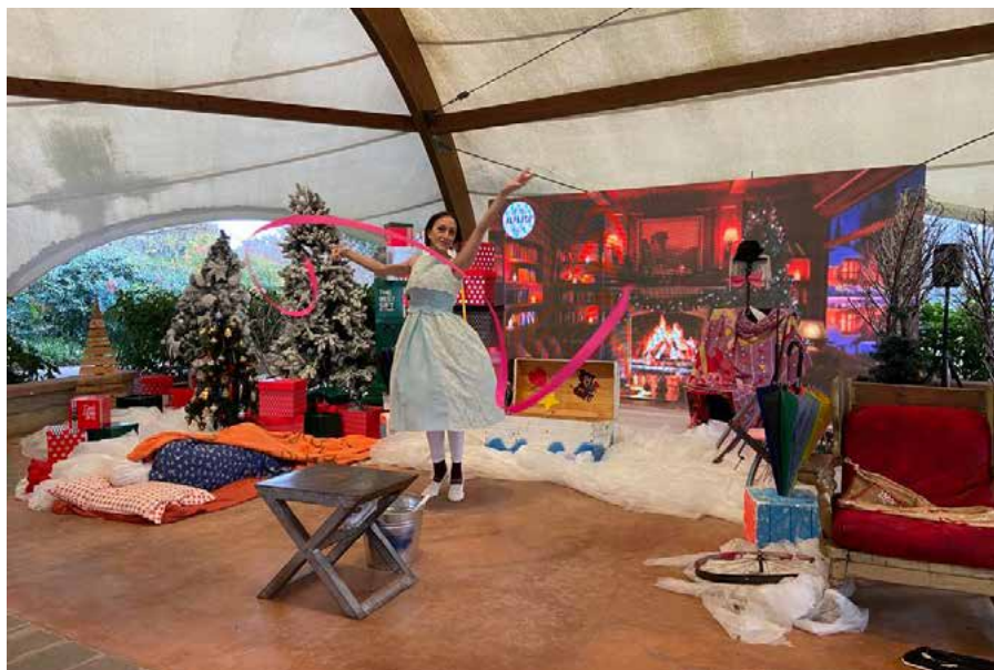
Il magico viaggio

IL MAGICO VIAGGIO: produzione del 2007. Che la vita sia un viaggio è ormai assodato, ma per i più piccoli la dimensione del viaggio è ancora una scoperta entusiasmante. Quando poi il cammino ci conduce nel paese della fantasia, attraverso incontri inaspettati e continue sorprese, il coinvolgimento è ancora più appassionante. Con la guida di un buffo mago pasticcione e della sua tenera assistente che si muove a passi di danza, si entrerà in punta di piedi in un mondo dominato dalla poesia. Questo spettacolo è pensato appositamente per i bambini, per giocare con i desideri e i sogni in un cammino che ha i colori, le sensazioni e la dolcezza dell'infanzia.