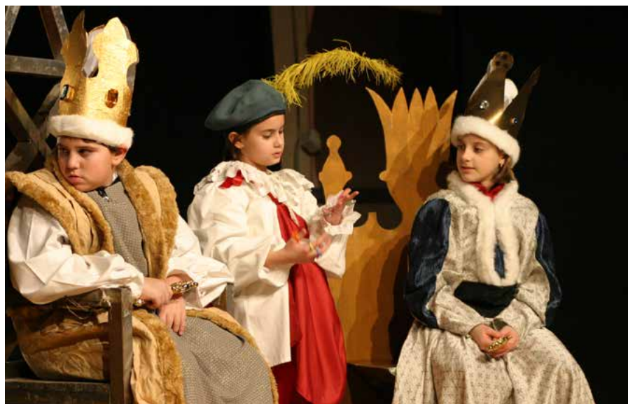
Saggio attori in erba "I vestiti nuovi dell'imperatore"