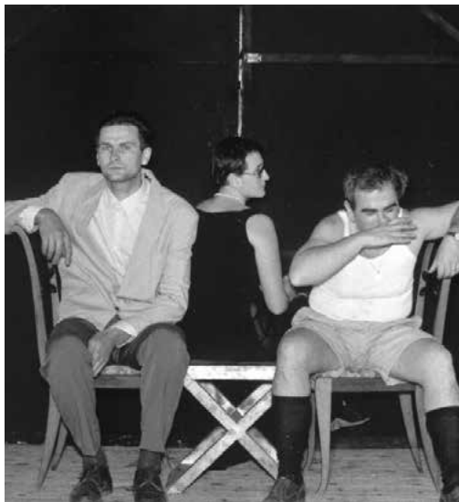
Amori in corso