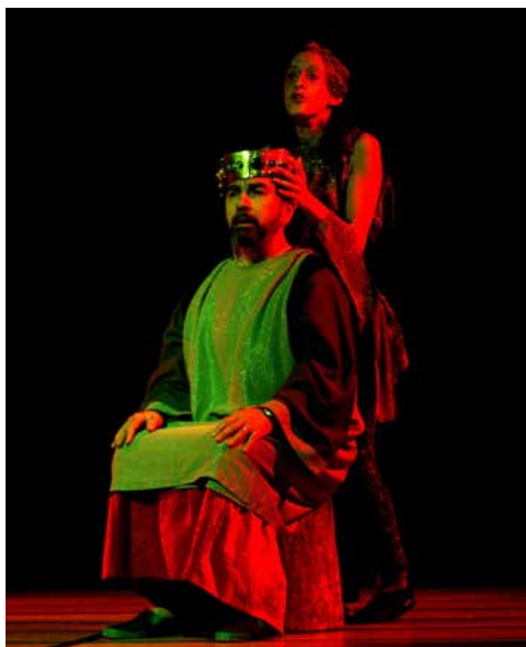
Viaggio per le terre dei longobardi

Dato che le fonti storiche non sono complete e che quelle letterarie risultano estremamente lacunose, il Teatro CaraMella ha lavorato a lungo su testi eterogenei per arrivare alla stesura di uno spettacolo: si è partiti naturalmente dall' Adelchi , per poi spaziare dalle Storie dell'anno Mille di Tonino Guerra e Luigi Malerba al Mistero Buffo di Dario Fo, all' Armata Brancaleone di Monicelli, alla Chanson de Roland e al Macbeth , solo per citare alcune delle fonti ispiratrici del testo. Ne è sorto uno spettacolo accattivante, la cui costruzione e messa in scena rappre-