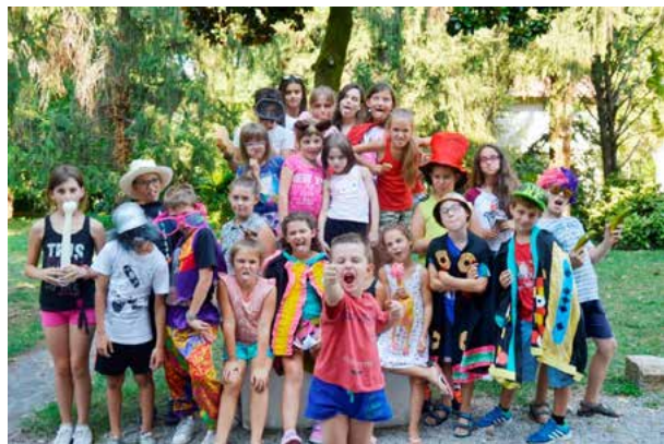
Sogno di un pomeriggio di mezza estate

In genere il Sogno di un pomeriggio di mezza estate vede la proposta di due settimane a Bagnolo Mella e due a Leno nel periodo di luglio e agosto.