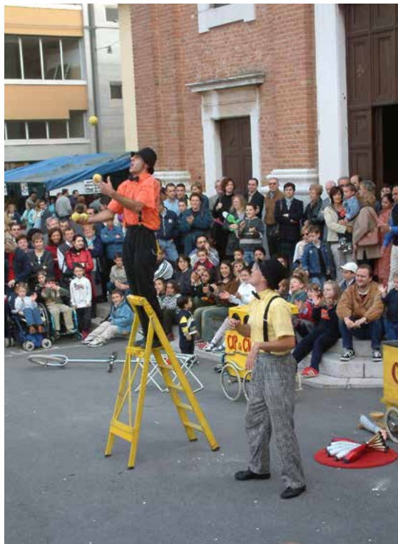
Artisti in piazza

negli anni successivi, anche se con un numero più limitato di artisti per consentire al pubblico di seguire tutti gli spettacoli proposti. In tutto sono state quattro le manifestazioni realizzate, poi, in accordo con l'Amministrazione Comunale che finanziava l'iniziativa, si è deciso di distribuire le risorse in un periodo più lungo di una singola giornata.