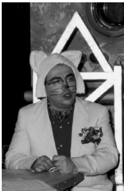
La notte dei desideri