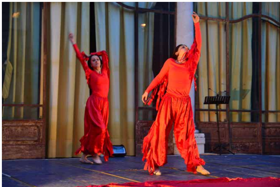
La Divina Commedia