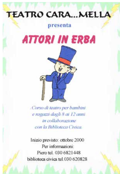
Locandina "Attori in erba"