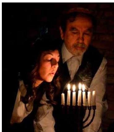
Pagina dopo pagina

E sempre in collaborazione con la Filarmonica di Bagnolo Mella, in occasione del 25 aprile 2002, viene presentato per la prima volta uno spettacolo tuttora in repertorio: Pagina dopo pagina , tratto dal famoso Diario di Anna Frank.